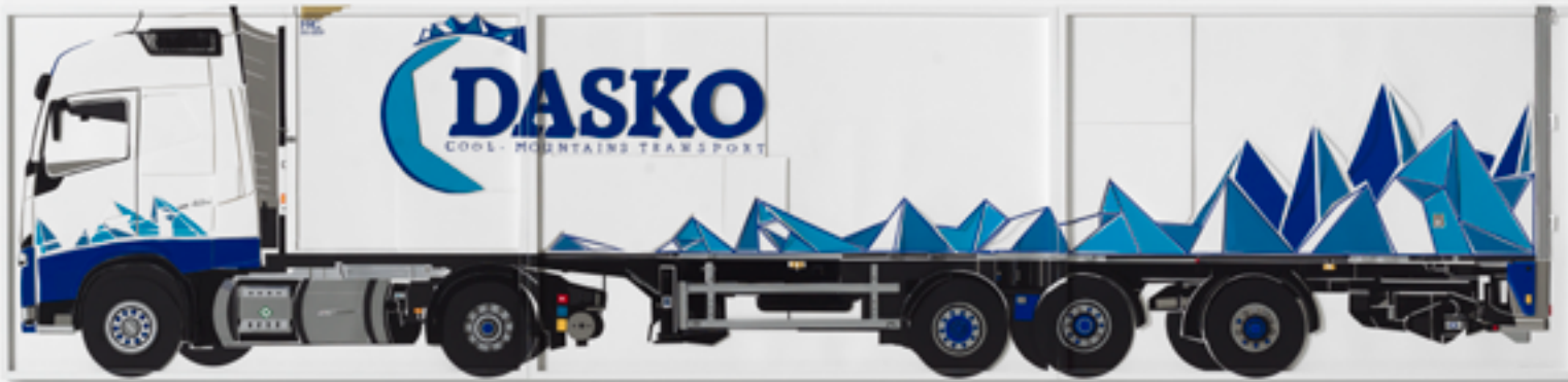
Marion Eichmann | Cool Mountains | 2021 | 72,5 x 308 cm, 3teilig | Papier

info@galerie-tammen.de www.galerie-tammen.de