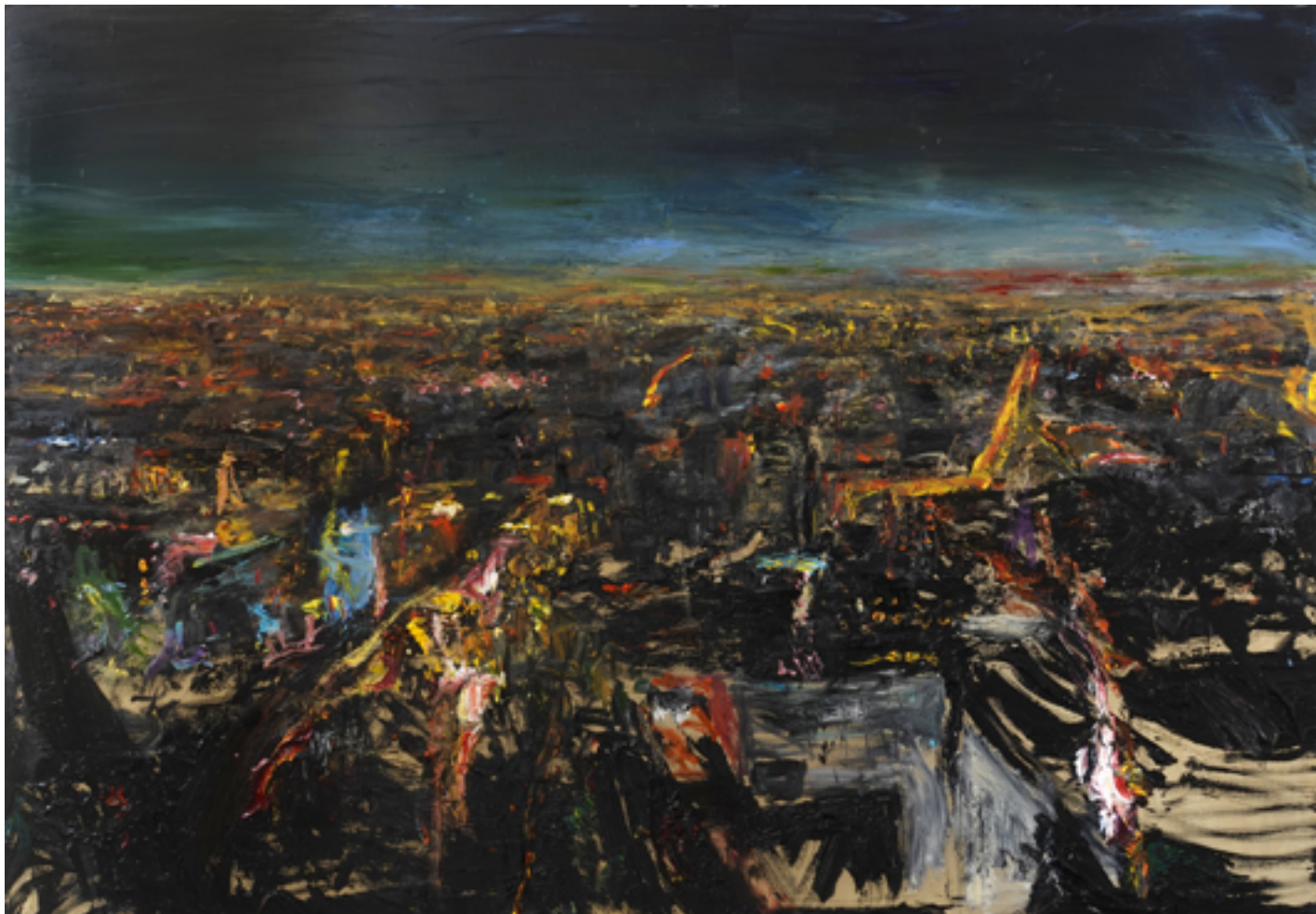
Michael Ramsauer | Nachtstadt 1 | 2021 | Öl / Leinwand | 120 x 170 cm